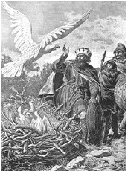
Rysunek nr 2. Lech z braćmi przy gnieździe orła