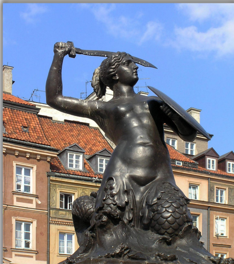
Pomnik Syreny – monument znajdujący się na Rynku Starego Miasta.