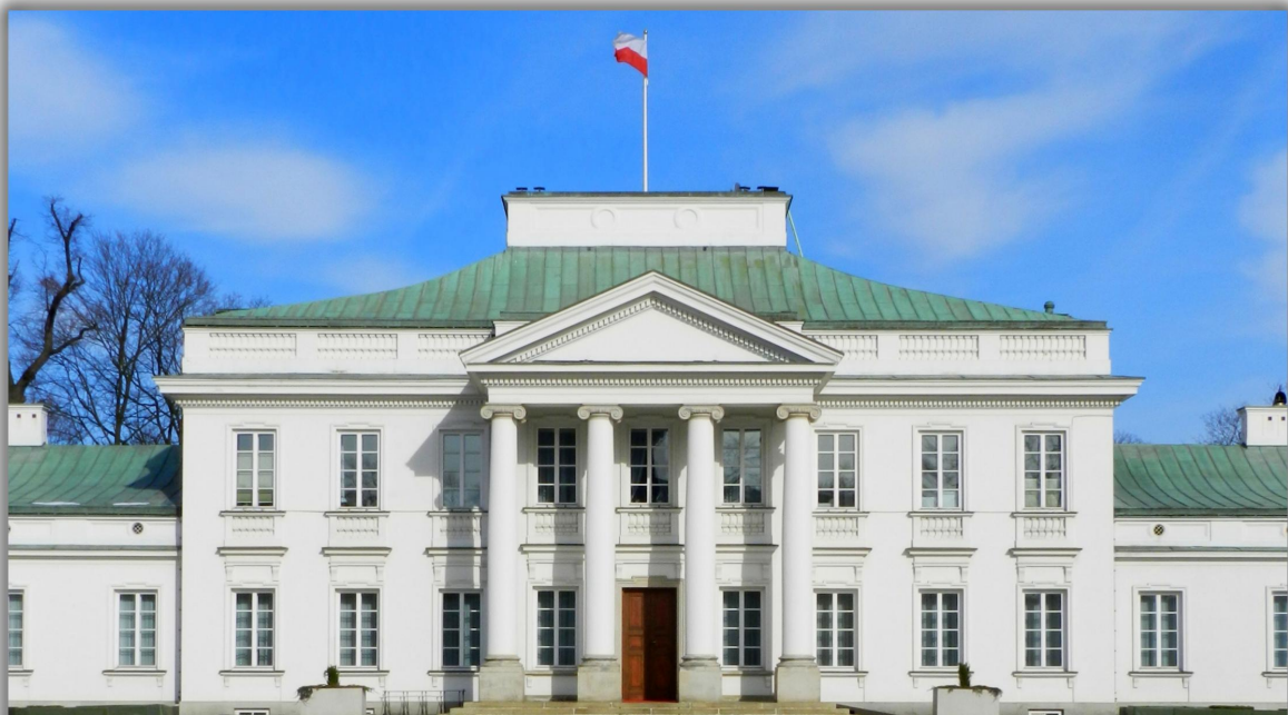
Belweder w Warszawie - Klasycystyczny pałac powstał w latach 1819–1822 według projektu Jakuba Kubickiego.