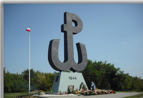
Pomnik Polski Walczącej – metalowy pomnik zlokalizowany na szczycie Kopca Powstania Warszawskiego.