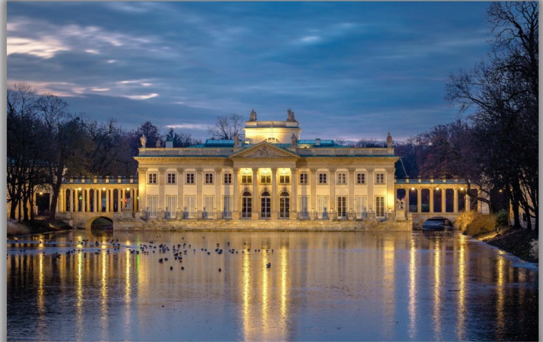
Łazienki Królewskie - zespół pałacowo-ogrodowy w Warszawie założony w XVIII wieku przez Stanisława Augusta Poniatowskiego