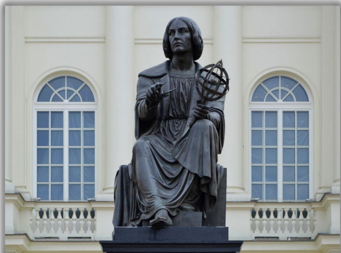
Pomnik Mikołaja Kopernika w Warszawie – pomnik dłuta duńskiego rzeźbiarza Bertela Thorvaldsena znajdujący się przed Pałacem Staszica.