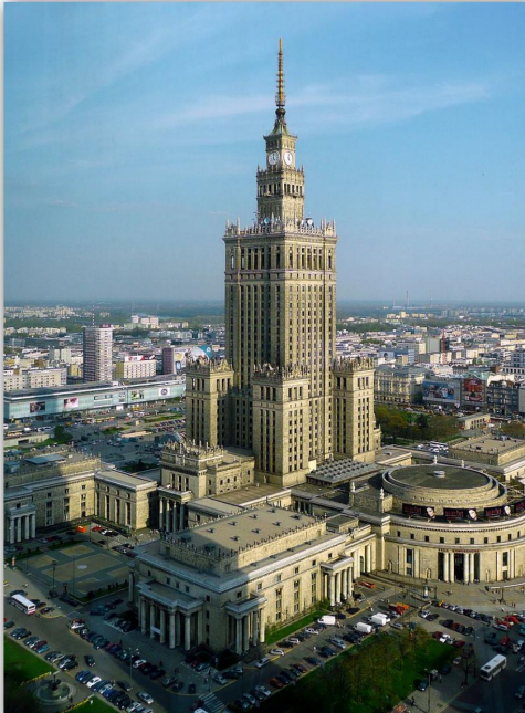
Pałac Kultury i Nauki im. Józefa Stalina (1953–1956)