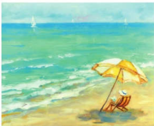
Oleg Sumarokov Kobieta pod parasolem odpoczywająca na plaży

Oleg Sumarokov „Kobieta pod parasolem odpoczywająca na plaży”