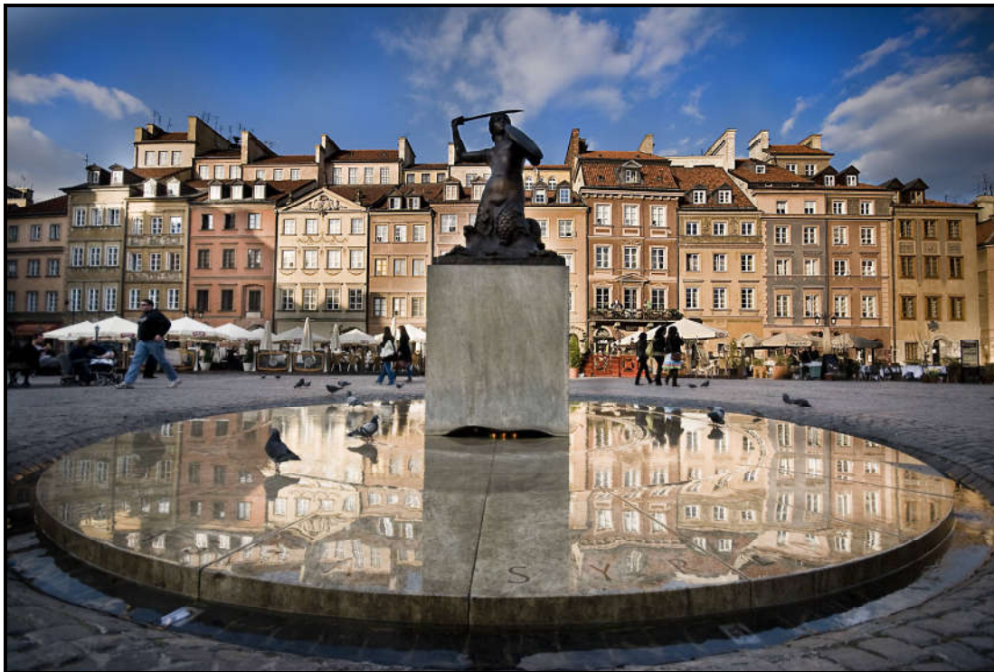
Rynek Starego Miasta w Warszawie