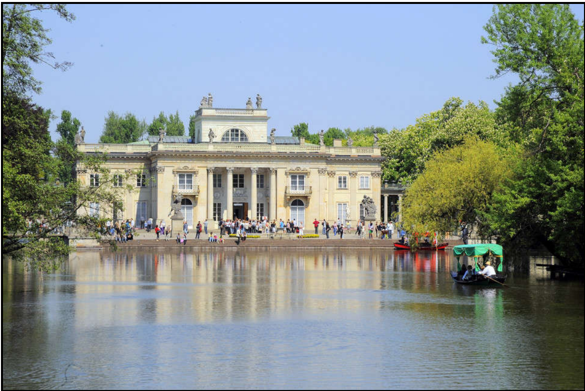
Pałac w Łazienkach Królewskich