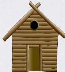
hut chałupa, szalas