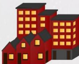
block of flats blok mieszkalny