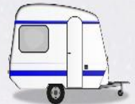
trailer, caravan przyczepa kempingowa