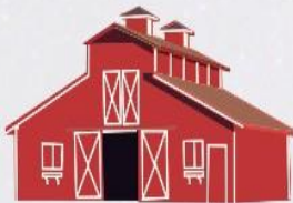
barn stodoła, obora