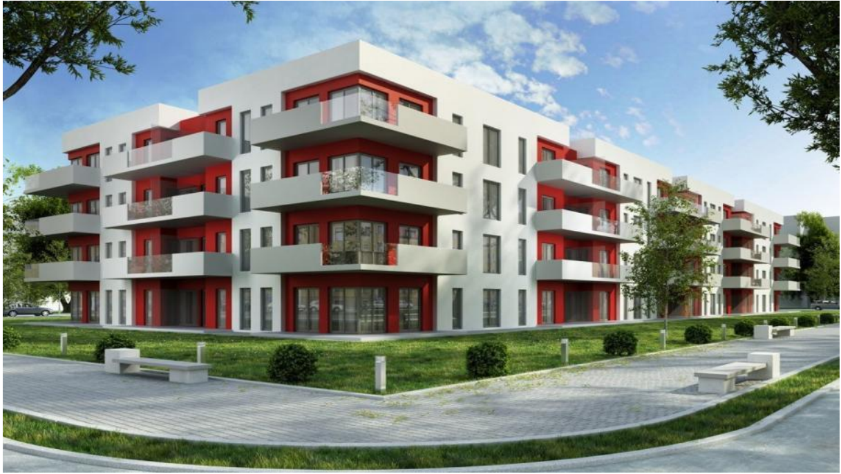
Bloki w mieście