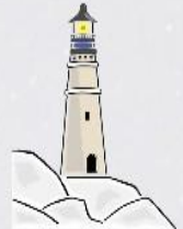
lighthouse latarnia morska