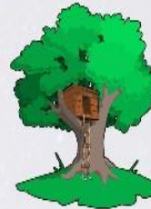
tree house domek na drzewie