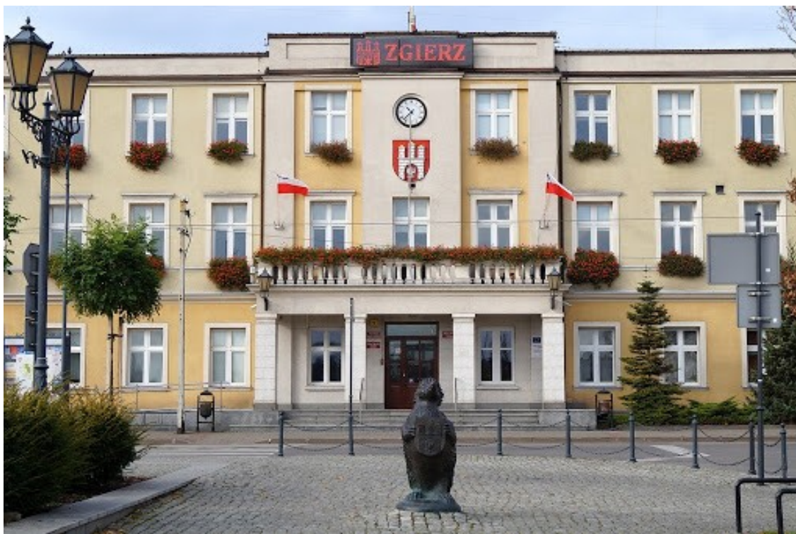
Dawny ratusz obecnie Urząd miasta Zgierza