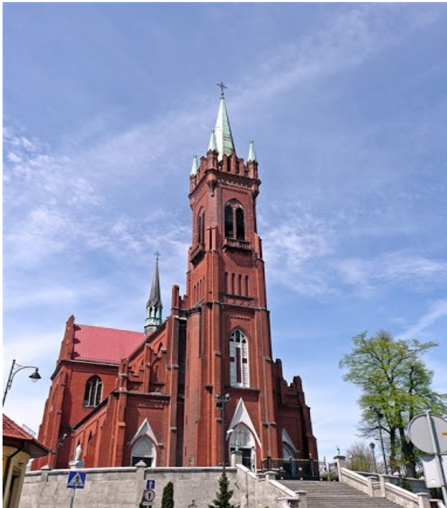
Kościół św. Katarzyny